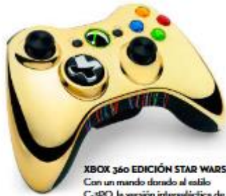
XBOX 360 EDICIÓN STAR WARS Con un mando dorado al estilo C-3PO, la versión intergaláctica de la Xbox 360, de Microsoft, salió a la venta hace cuatro años y se ha convertido en un imprescindible para los amantes de Star Wars. C.P.N.

Fecha: Octubre 16 Medio: Marca Estilo Producto: Light Therapy - Devices