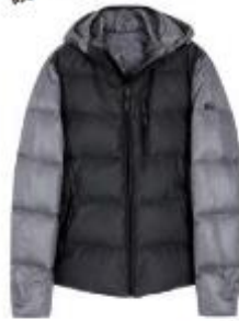
PEDRO DEL HIERRO. Por mucho que cuente aceptarlo, el frío ya está aquí. Para llevarlo con estilo, Pedro del Hierro presenta esta cazadora en tonos grises con relleno de plumas natural y otros tejidos combinados. PVP: 399 euros.