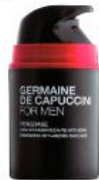
GERMAINE DE CAPUCCINI. Su emulsión energizante antiedad regenera la piel del rostro y ejerce una acción genoprotectora frente a las agresiones medioambientales. De textura ligera y fácil aplicación. PVP: 44 euros.