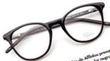
ALAIN AFFLELOU. El modelo 'Sophie de Afflelou' presuma de una sensual forma de ' ojo de gato' en dos estilos: en color negro con un acabado brillante (en la imagen) y en una combinación de carey color habano y rosa travésido. En ambos modelos las varillas son extra finas. C.P.N.