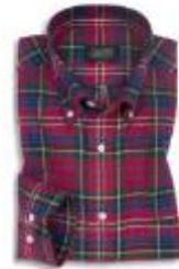
MIRTO. La nueva colección de la firma española Mirto 'viste' la temporada Otoño/Invierno de este año con mucho estilo. Es el caso de esta camisa de franela con tonos cereza y con botón en el cuello. PVP: 105 euros.