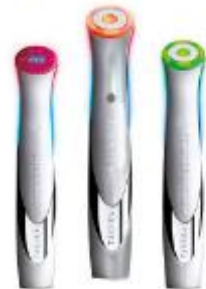
TALIKA. Sus 10 años de estudio sobre los usos estéticos de la luz han dado como resultado Light Therapy. Cada color tiene un efecto sobre el rostro: el naranja reduce arrugas, el rojo elimina rojeces y el verde, manchas. PVP: 99 euros por unidad.