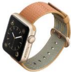
APPLE WATCH SERIES 2 La nueva generación del reloj inteligente más famoso es resistente al agua e incluye GPS. Está disponible en cajas de aluminio en oro, oro rosa, plata o gris espacial y 10 modelos de correas. PVP: desde 439 euros.