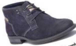
PAREDES. Tienen en el armario unas botas que combinan con todo es necesario. Para finalizar este hueco, la marca Paredes lanza sus Magic Boots, la opción perfecta para pantalones pitillo y chinos estilo 'joggers'. 100% piel de serpiente con efecto desgastado. PVP: 529,90 euros.

BOTAS QUE DEJAN HUELLA O CREMAS QUE LUMINAN EL ROSTRO. LO ÚLTIMO EN MODA Y COSMÉTICA LLEGA CON FUERZA