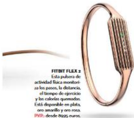
FITBIT FLEX 2 Esta pulsera de actividad física monitoriza los pasos, la distancia, el tiempo de ejercicio y las calorías quemadas. Está disponible en plata, oro amarillo y oro rosa. PVP: desde 29,95 euros.

BOTAS QUE DEJAN HUELLA O CREMAS QUE LUMINAN EL ROSTRO. LO ÚLTIMO EN MODA Y COSMÉTICA LLEGA CON FUERZA